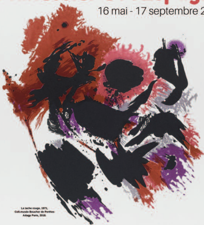
La tache rouge, 1971. Coll. musée Boucher de Perthes Adagp Paris, 2018.