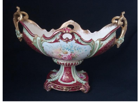
Restauration illusionniste d'une anse de coupe. Avant restauration, reconstitution en mastic, après dorure.