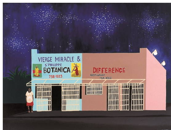
Hervé DI ROSA, Botanica , 2003