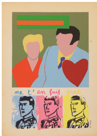
Hervé DI ROSA, Ne t'en fais pas , 1978