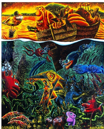
Hervé DI ROSA, Dirosouleau , 1985