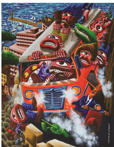
Hervé DI ROSA, L'autocar des vacances , 2010