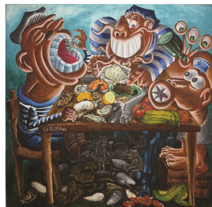
Hervé DI ROSA, La Mangeaille , 1986