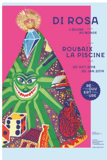
Hervé Di Rosa, Virgen del arte blanco – Étape 18 : Séville, Espagne, 2013

Musée d'Art et d'Industrie André Diligent