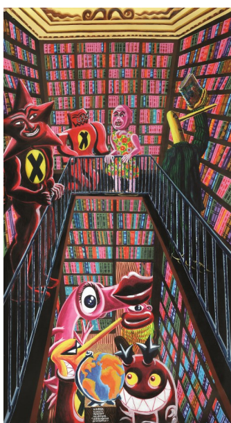
Hervé DI ROSA, La bibliothèque de Victor Plat , 2017