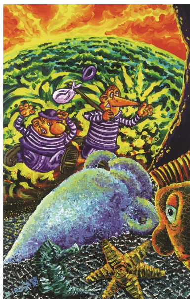
Hervé DI ROSA, Les 2 vagabonds et la mer , 1988