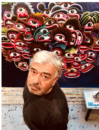
Hervé DI ROSA © Victoire Di Rosa