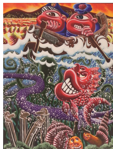
Hervé DI ROSA, René sous l'eau , 2011