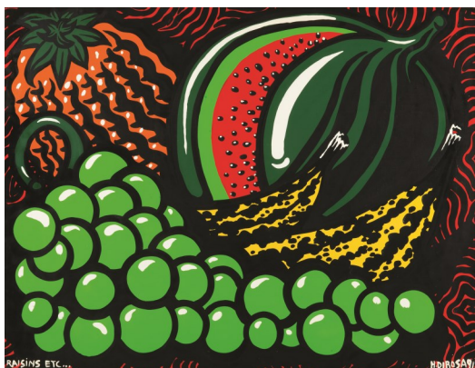
Hervé DI ROSA, Raisins etc... , 1991